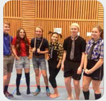
TBS Karlstad anordnade dodgeball-turnering med lagteman.

Som om inte ett stort event vore nog firade vi också i november av Elevkårens dag med dunder och brak. Elevkårer runtom i landet firade på olika sätt och såg till att pryda skolorna med ballonger, bubbel, tårta och tävlingar. I Uppsala tävlade Skrapans medlemmar i poängjakt (och vann TV-apparater!) och i söder bjöd Malmös Elevkårer in till Elevkårs gala.