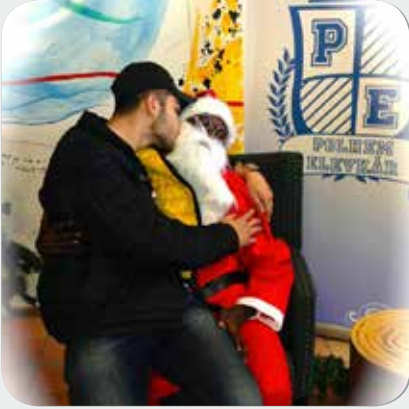
Jultomten kom till Polhem Elevkår som anordnade fotografering.