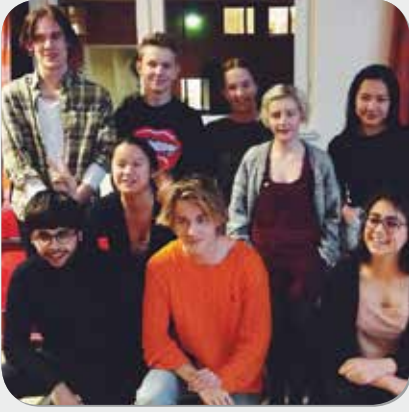
Den nya styrelsen i Midgårds Elevkår i Umeå.