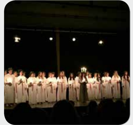
Hos SÄG:s elevkår anordnades luciatåg.