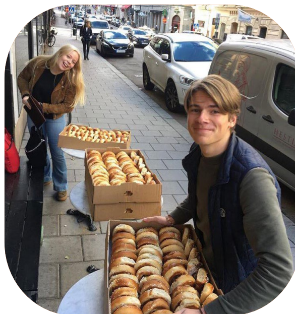
Viktor Rydberg Gmnasium Jarlaplans elevkår på kanelbullens dag.