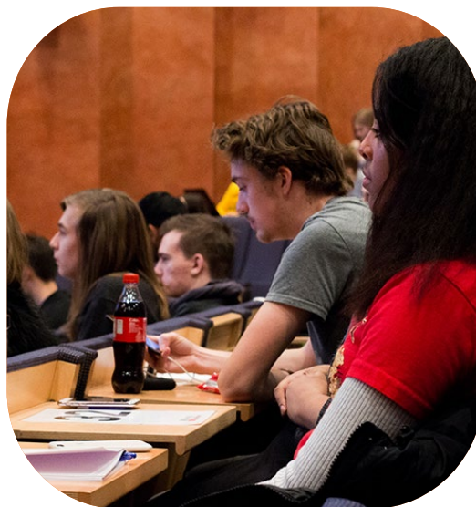
Bild från Årsmöte17 i Göteborg.