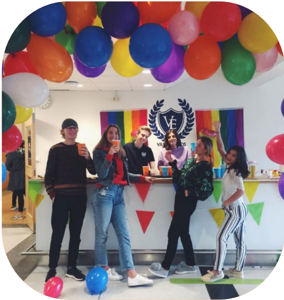
Västerhöjd Gymnasieskolas elevkår i Skövde firar pride och halloween.