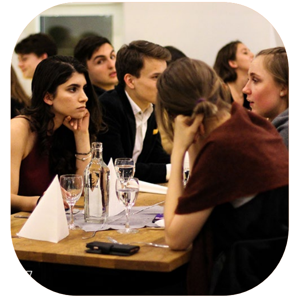
Bilder från Årsmöte17 i Göteborg.