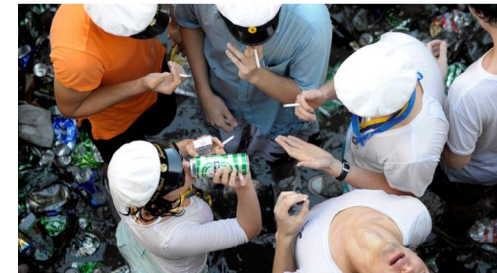
Gratis studentmössor är en av sakerna som företagen försöker locka med.

Publicerat torsdag 16 november 2017 kl 06:00