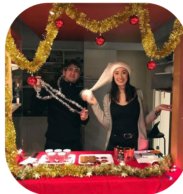
KS-kåren (Kungsängsgymnasiet) i Sala.