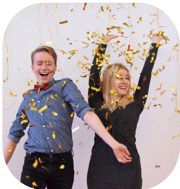
Finfredag på Ållebergsgymnasiet i Falköping.