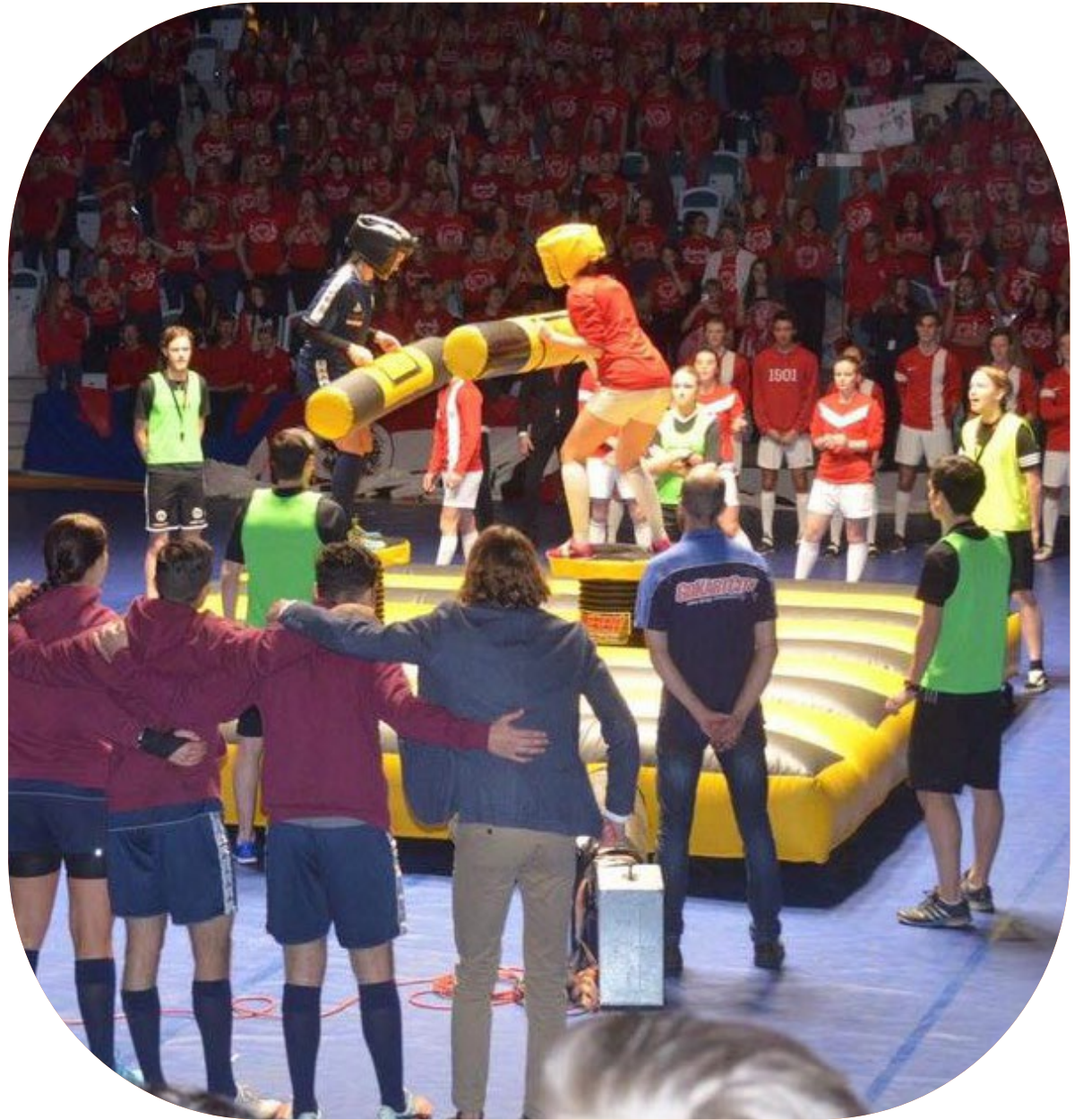
Skolkampen, Elevkåren Teknis (Sven Eriksonsgymnasiet) vs. Elevrådet Halib (Bäckänggymnasiet) i Borås.