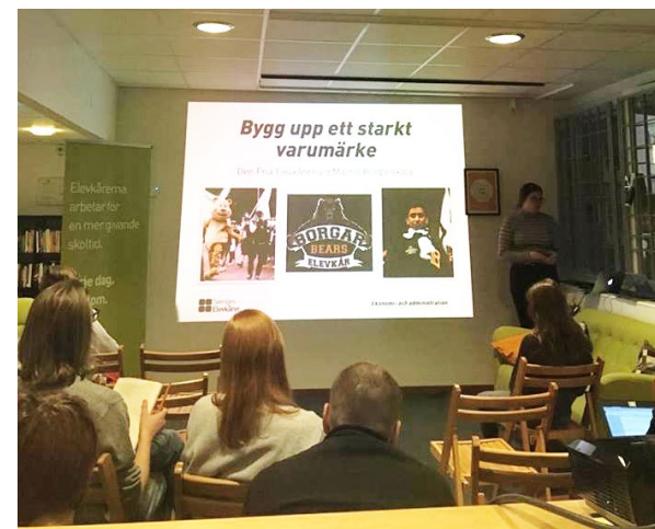
Bild från region Östs utbildningsdag. Närvarade gjorde: Norra reals elevkår, Klara södras elevkår, Franska skolans elevkår, Trädgårdsskolans Elevråd, EB elevkår, Höglandsskolans elevråd, Aspuddens elevråd och Kunskapsskolan Västerås elevråd.

Vi ser med glädje på den positiva utvecklingen av antal utbildade elevkårer då det har en direkt koppling till hur stark och bred verksamhet som elevkårerna bedriver runtom i landet. Med Q1 i ryggen ser vi att 2018 har all potential att bli året då fler elevkårer blir starka majoritetskårer med verksamhet inom alla aktivitetsområden. Allt för att kunna bygga en starkare elevrörelse!