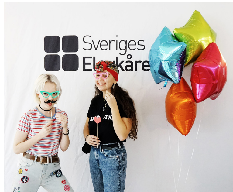
Region Väst - i Göteborg.