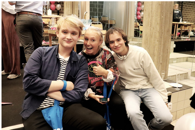
Region Öst - i Stockholm.