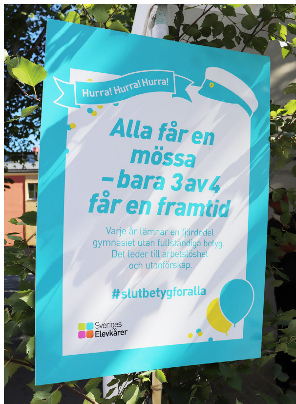
Almedalen 2018. "Studentskytt" tillhörande kampanjen #slutbetygforalla.