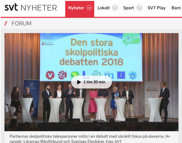
Partiernas skolpolitiska talespersoner möts i en debatt med särskilt fokus på eleverna. Arrangör: Lärarnas Riksförbund och Sveriges Elevkårer.

https://www.metro.se/artikel/debatt-vi-m%C3%A5ste-st%C3%A4rka-ungas-politiska-engagemang?fbclid=IwAR1VWkzP7mKSB41CYnCji5yMpmF6hSwZ5cZlY-lksve9PbRPnZJWi0A9rn64 https://www.dagenssamhalle.se/debatt/bjud-politiska-partier-till-skolan-23435 https://www.svt.se/nyheter/svtforum/politisk-debatt-om-framtidens-skola