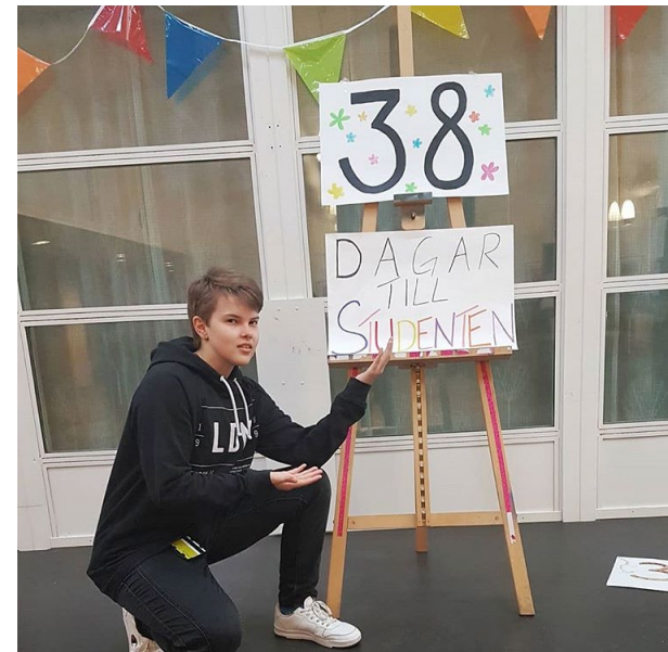
Kåres Kår i Falun kör nedräkning till studenten.