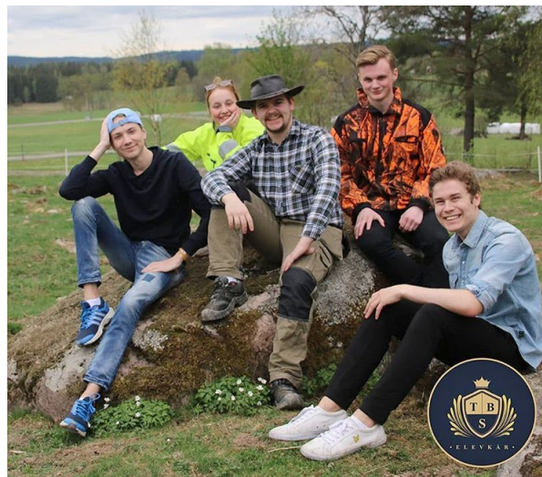
TBS Karlstad elevkår presenterade sin nya styrelse i maj.