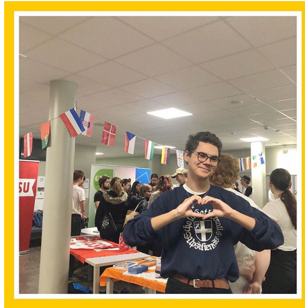
Elevkåren Katedral i Uppsala hade paneldebatt och EU-torg med bokbord i samband med Europaparlamentsvalet. Detta var arrangerat av det kulturella utskottet.