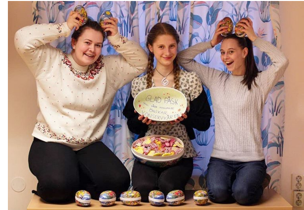
Nya styrelsen för Musikkonservatoriets elevkår i Falun ordnade påskäggsjakt i april.