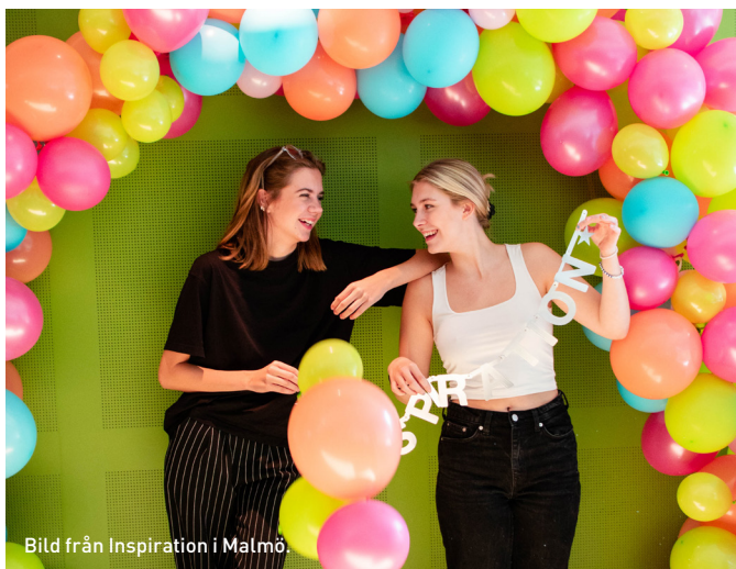
Bild från Inspiration i Malmö.