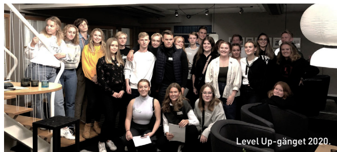
Level Up-gänget 2020.

Level Up är en utbildning som främst riktar sig till ordförande eller vice ordförande som vill få verktyg till att stärka och utveckla sin elevkår. Låter utbildningen intressant? Håll utkik här efter när anmälan till hösten 2021 drar igång!