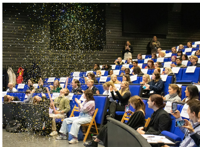
Sveriges Elevkärers styrelse för mandatperioden 2021-2022 ges ansvarsfrihet.

Alla beslut kan du läsa här i mötesprotokollet.