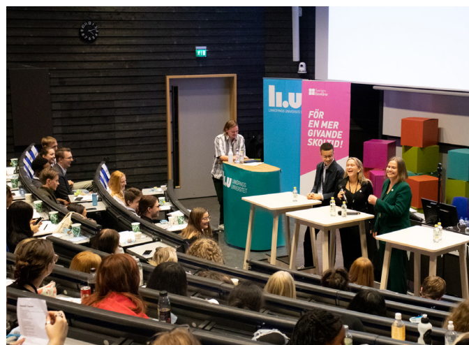
Utfrågning av årets kandidater till styrelsen.