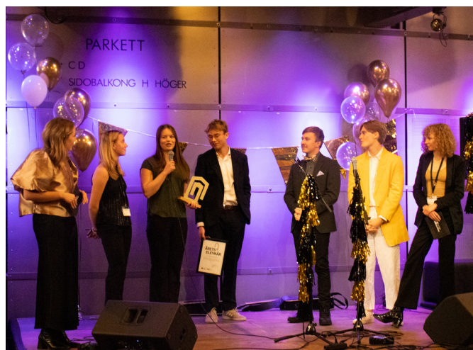
Anna Whitlocks Elevkår tar emot priset Årets Elevkår.