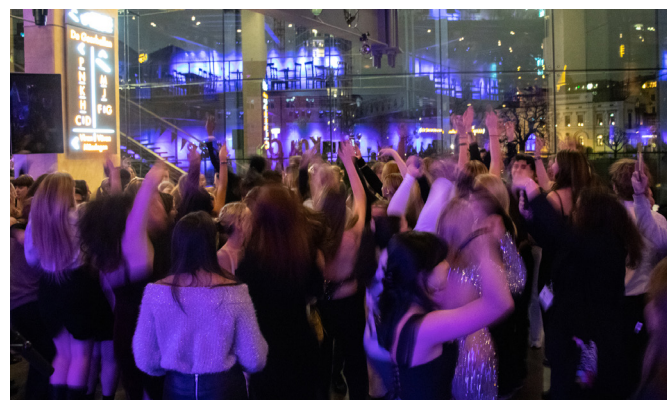
Dansgolv efter kongressens galamiddag.