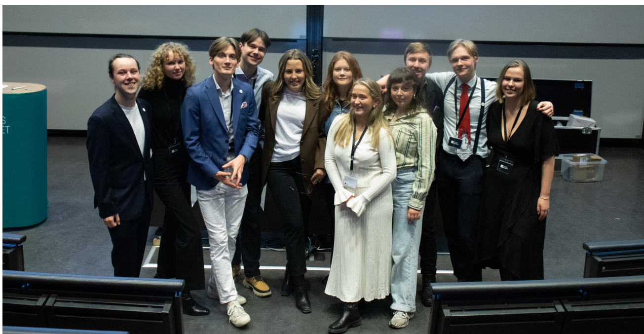
Sveriges Elevkårers styrelse för mandatperioden 2021-2022.