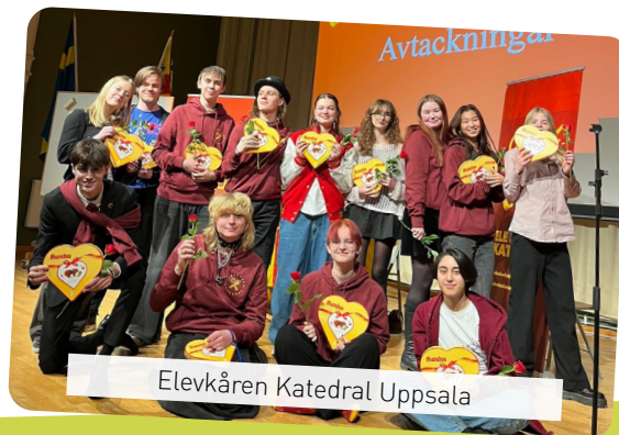
Elevkåren Katedral Uppsala