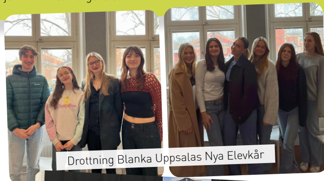
Drottning Blanka Uppsalas Nya Elevkår