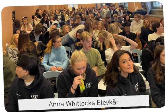
Anna Whitlocks Elevkår