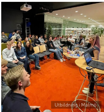
Utbildning i Malmö

Under utbildningshängen har totalt 348 elevkårsaktiva utbildats i årsmöte och överlämning!