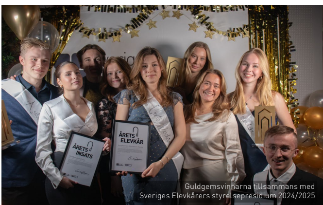
Guldgemsvinnarna tillsammans med Sveriges Elevkårs styrelsepresidium 2024/2025

Under kongressens sista dag röstade medlemmarna fram en ny ordförande, styrelse och revision för Sveriges Elevkårer för mandatperioden 25/26.