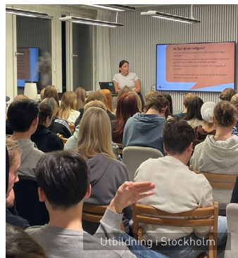
Utbildning i Stockholm