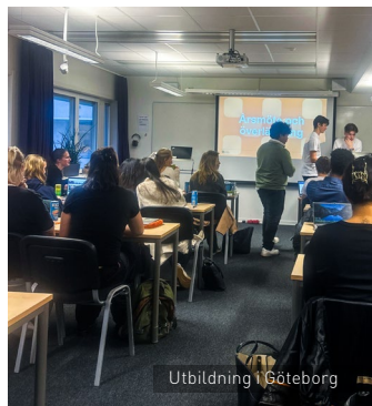
Utbildning i Göteborg