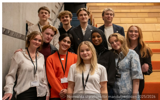
Nyvalda styrelsen för mandatperioden 2025/2026