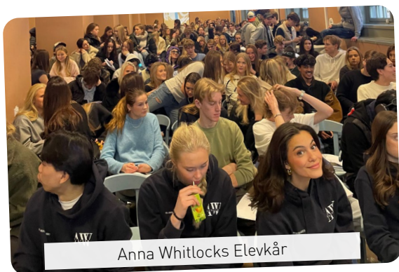
Anna Whitlocks Elevkår