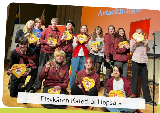
Elevkåren Katedral Uppsala