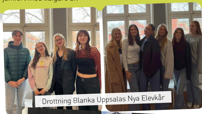
Drottning Blanka Uppsalas Nya Elevkår