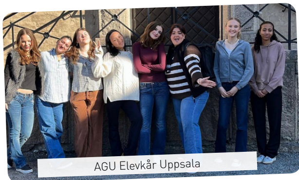
AGU Elevkår Uppsala