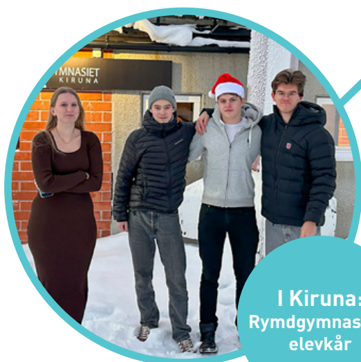
I Kiruna: Rymdgymnasiets elevkår

Sveriges Elevkårer samlar i skrivande stund fler än 330 elevkårer, från Kiruna i norr till Trelleborg i syd. Vi har träffat en elevkår från respektive stad och pratat med dem om elevkårsarbetet i praktiken.