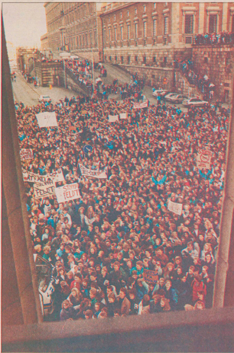
10 000 elever samlades på Mynttorget utanför utbildningsdepartementet på onsdagen för att protestera mot regeringens skolpolitik.

I den inledande motionsfloden i riksdagen föreslår folkpartiet att Sverige ställer upp på att Polen får kvitta en del av sin stora utlandsskuld mot att landet gör miljönvesteringar. Sidan 12